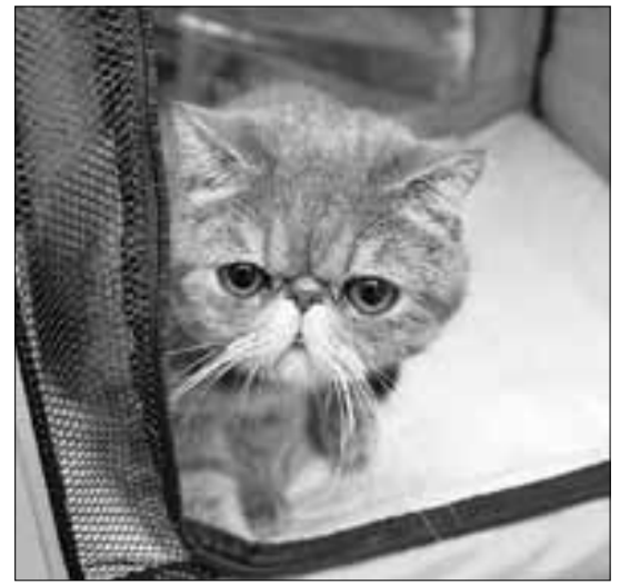
■ Ну разве я не милашка?!