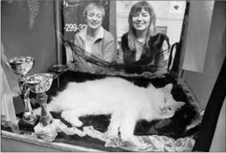
■ Выставки – это так утомительно...